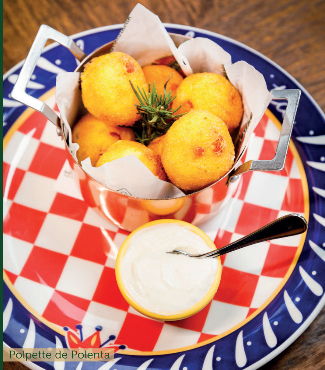
Polpette de Polenta

*OPÇÕES PARA PRATOS COM MOLHO: MOLHO DA MAMMA; MOLHO 4 QUEIJOS; MOLHO SUGO; MOLHO AO PESTO; MOLHO ALHO E ÓLEO.