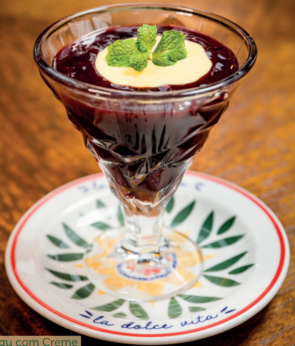
Sagu com Creme